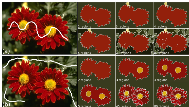
Figure 1. Dois conjuntos de treinamento utilizados (objeto e background), demonstrando 2 minimizações diferentes da energia, ambas de 80 para 2 regiões.

strados nos mapas topológicos no documento de dissertação 3 , seção 4.2.3, ou em [Sobieranski et al. 2011]. Quanto a função de aproximação, esta teve seus termos penalizados alterados de modo que a topologia de M pudesse trabalhar harmonicamente e com regularidade conforme as regiões fossem agrupadas.