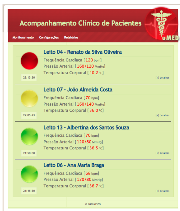
Figura 2. Monitoramento Pró-ativo de Pacientes