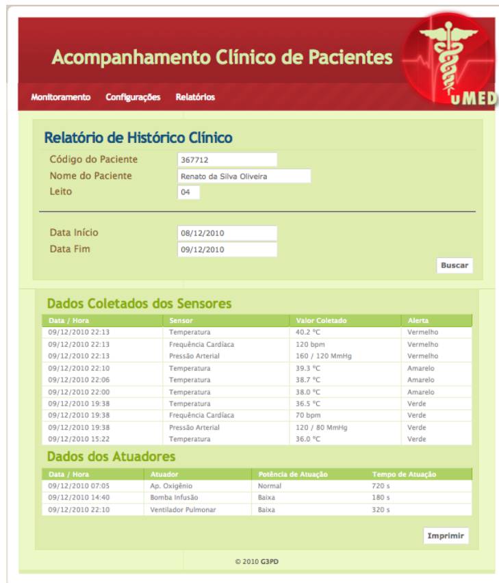
Figura 3. Relatório de Histórico Clínico

Assim como o uMED, os demais projetos estudados contemplam uma arquitetura para suporte à sensibilidade ao contexto, modelada para ser expansível, tanto no que diz respeito a captura de dados do ambiente ubíquo, bem como quanto aos possíveis consumidores de contextos de interesse.