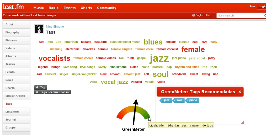
Figura 2: GreenMeter: Estimador de Qualidade e Recomendador de Tags (estudo de caso: LastFM)

Figura 3 mostra a tela do GreenWiki com os indicadores apresentados no canto superior direito e a tela que será aberta ao seu clicar no indicador de estabilidade.